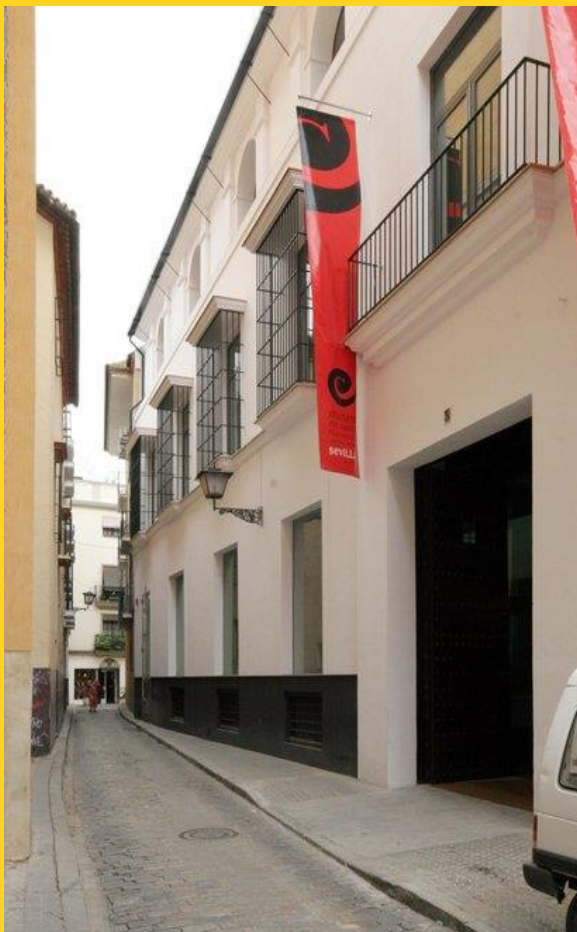
Musée du flamenco