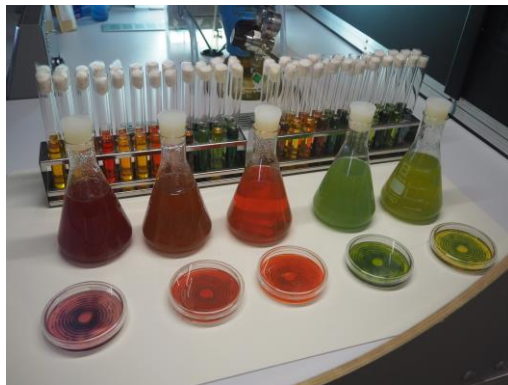
Les micro-algues, on en a parlé...les voilà !