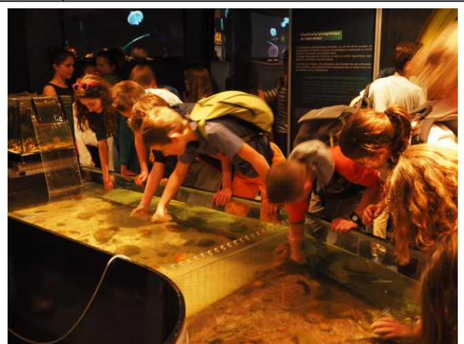
Le bassin tactile du pavillon tempéré